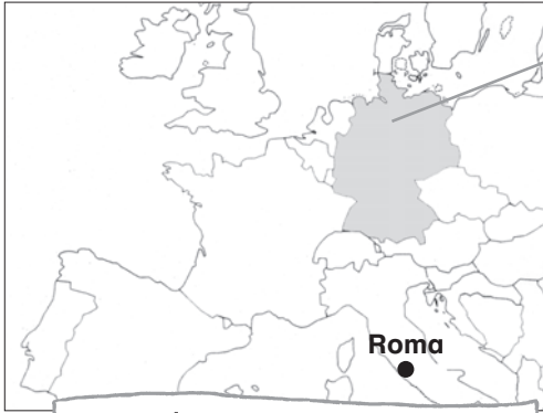
Rom im Jahre 753 v. Chr.