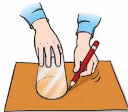
einen Kreis zeichnen