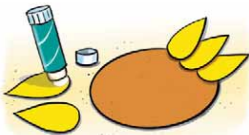
die Blätter aufkleben