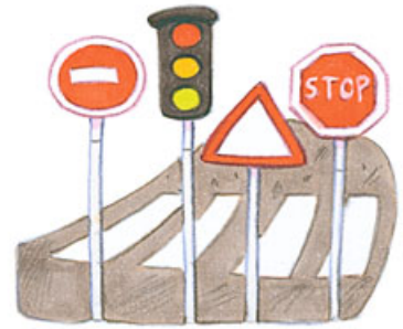
Andere Dinge 3